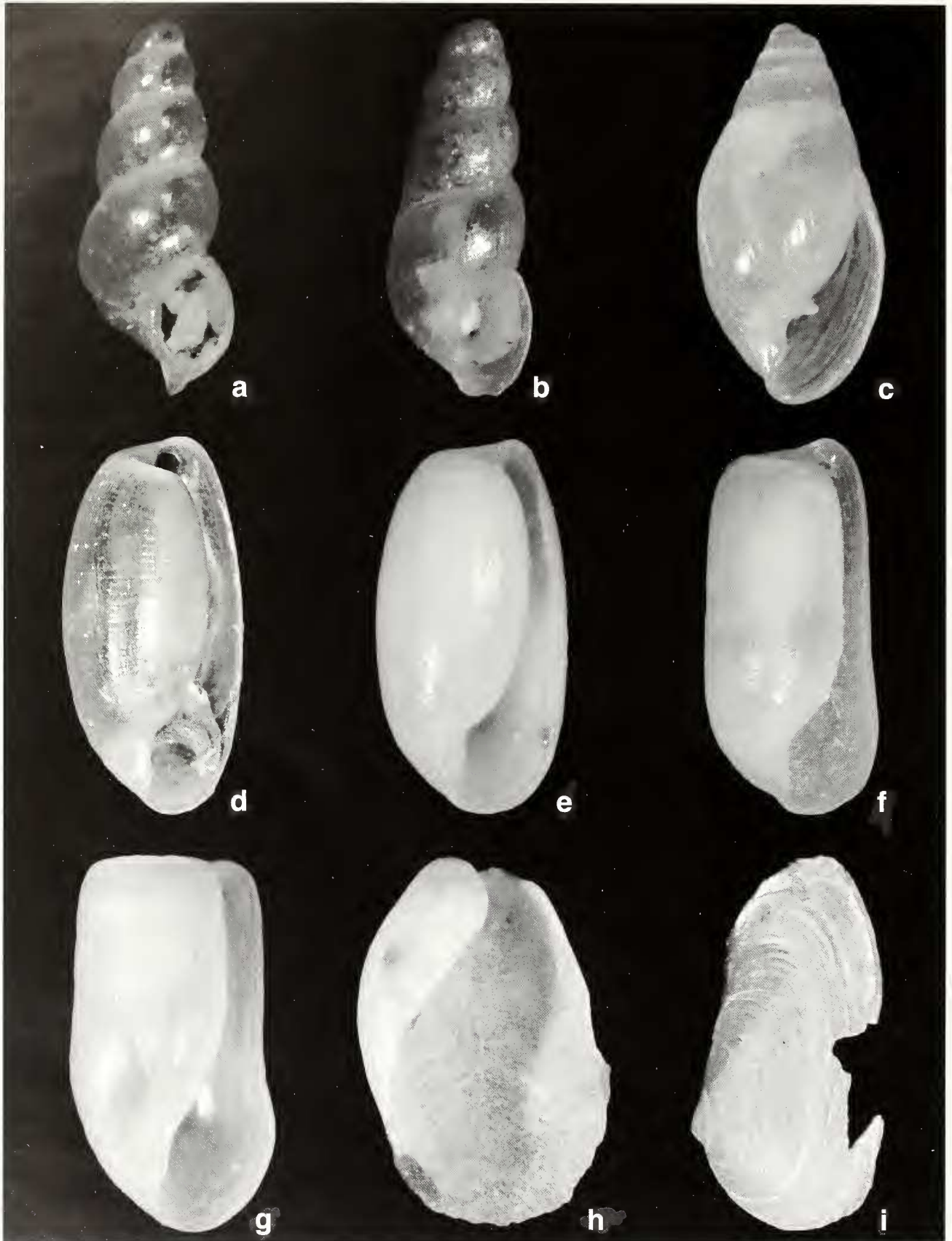
Fig. 3. a. Cima cylindrica , 1,13 mm; b. Cima minima , 1,18 mm; c. Auriculinea erosa , 2,63 mm; d. Atys jeffreysi , 3,55 mm; e. Cylichna crossei , 1,98 mm; f. Cylichna laevisculpta , 2,13 mm; g. Retusa leptoneilema , 1,89 mm; h. Philine catena , 2,62 mm; i. Sphenia binghami , 2,37 mm.